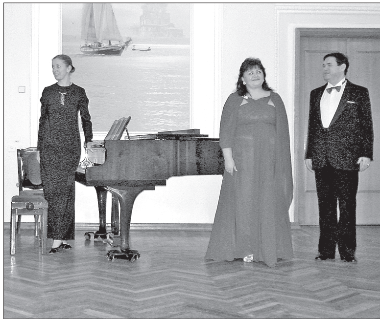
Концертом остались довольны и зрители, и артисты...

Музыку для отечественного кино сочиняли лучшие композиторы, поэтому ей уготована долгая жизнь. В концерте прозвучали «Песенка Лепелетье» из «Гусарской баллады», «Весна» из одноимённого кинофильма, «Я словно бабочка к огню» из «Же-